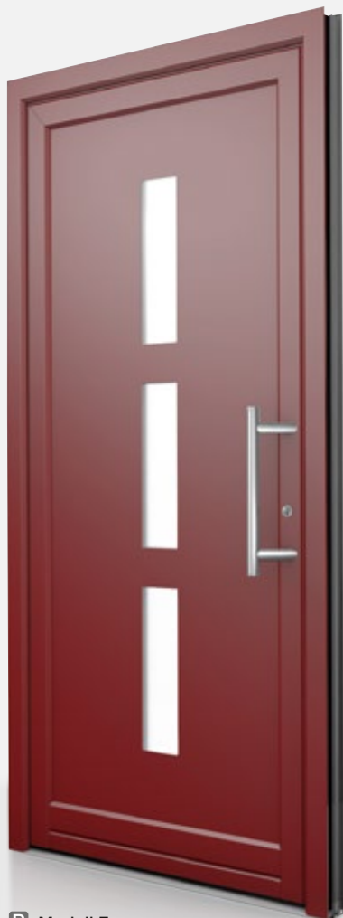
P Modell F

U_b = 1,5 \text{ W/m}^2\text{K} Farbe: HM304 Griff: HS10 Glas: Satinato weiß