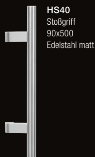
HS40 Stoßgriff 90x500 Edelstahl matt