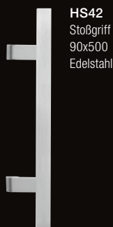
HS42 Stoßgriff 90x500 Edelstahl