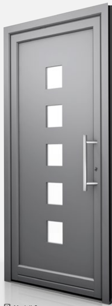
P Modell G

U_b = 1,5 \text{ W/m}^2\text{K} Farbe: HM304 Griff: HS10 Glas: Satinato weiß