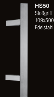
HS50 Stoßgriff 109x500 Edelstahl