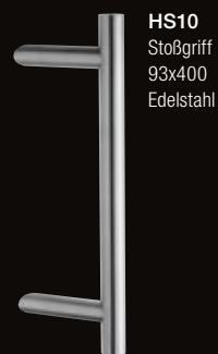
HS10 Stoßgriff 93x400 Edelstahl