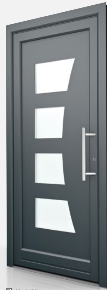
P Modell H

U_b = 1,5 \text{ W/m}^2\text{K} Farbe: HM907 Griff: HS10 Glas: Satinato weiß